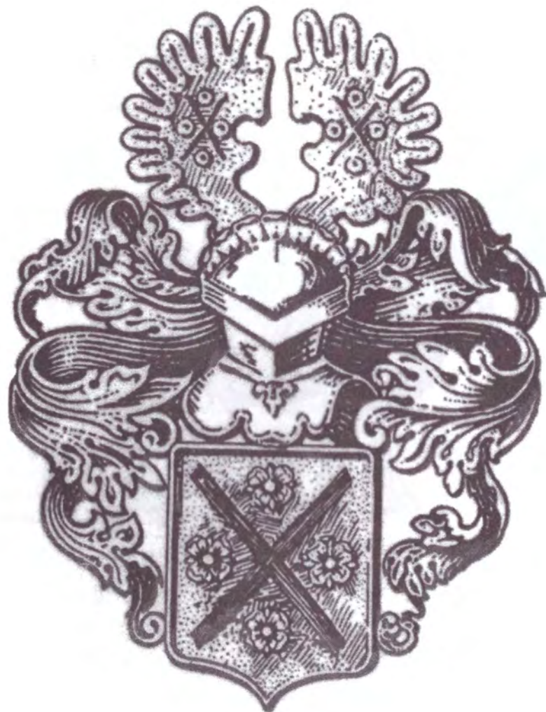
Crucea Sfântului Apostol Andrei