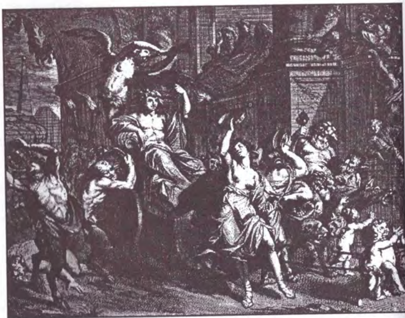
Bachantele și festivitatea lui Bachus