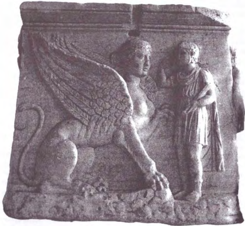
Sphinxul și regele Edip