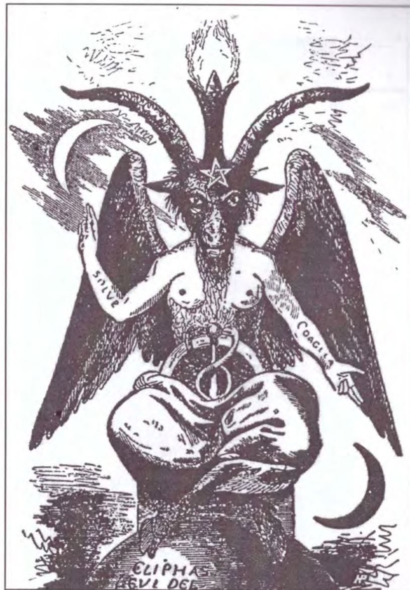
Zeul Pan – zeul adorat de masoni