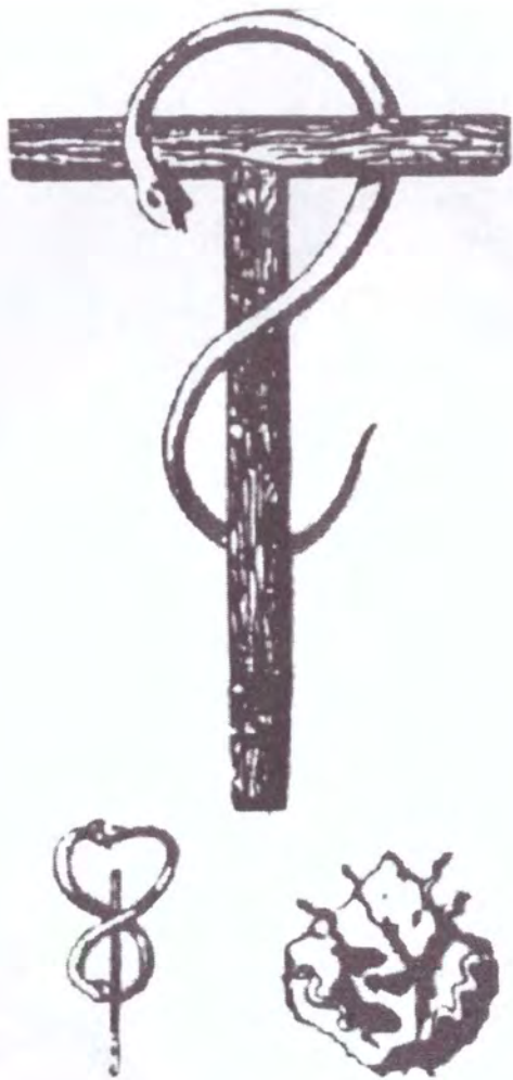
Crucea numită Tau, simbol masonic folosit și de bisericile ortodoxe