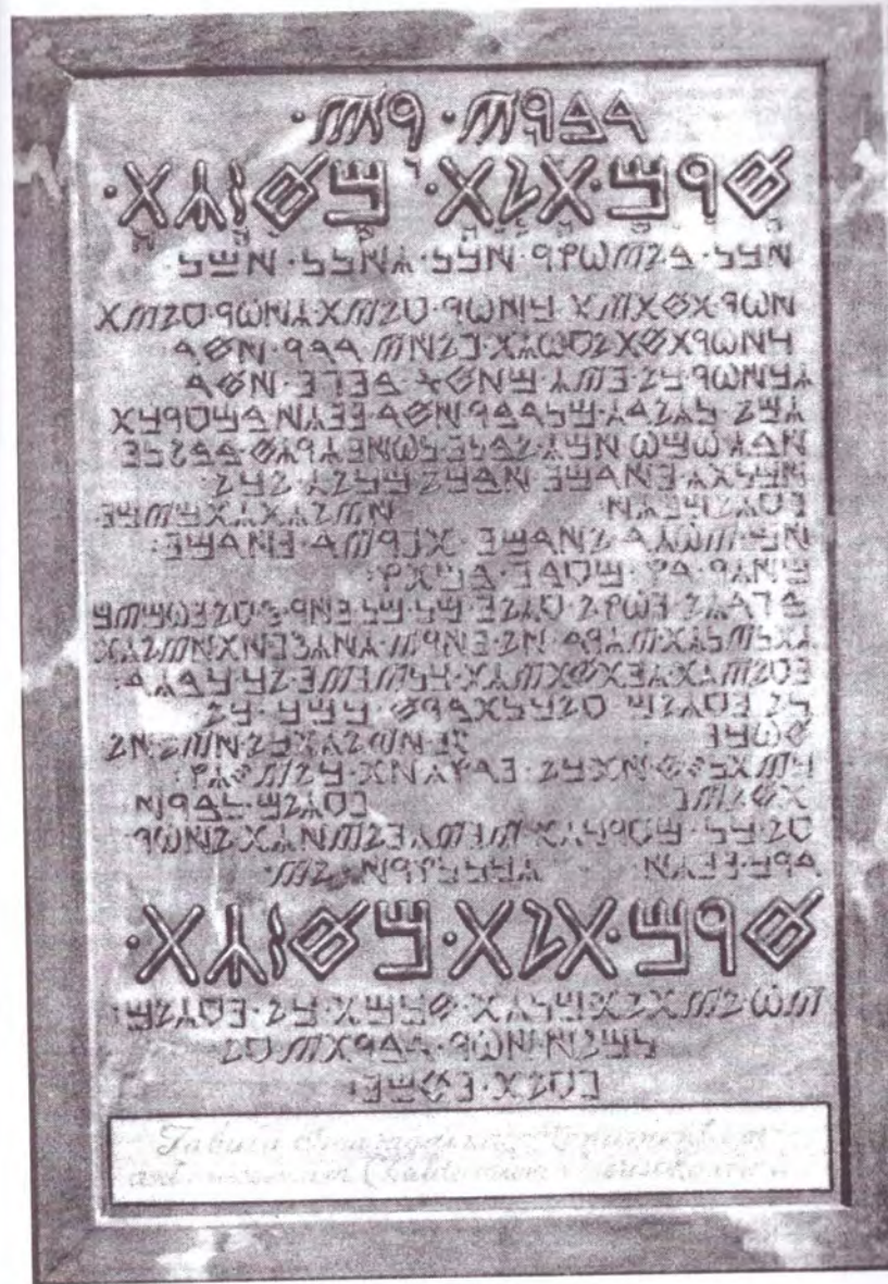
Tabla lui Hermes